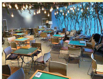
会場：クラシティ2階「Farm@」