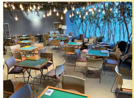
会場：クラシティ2階「Farm@」