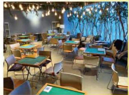
会場：クラシティ2階「Farm@」